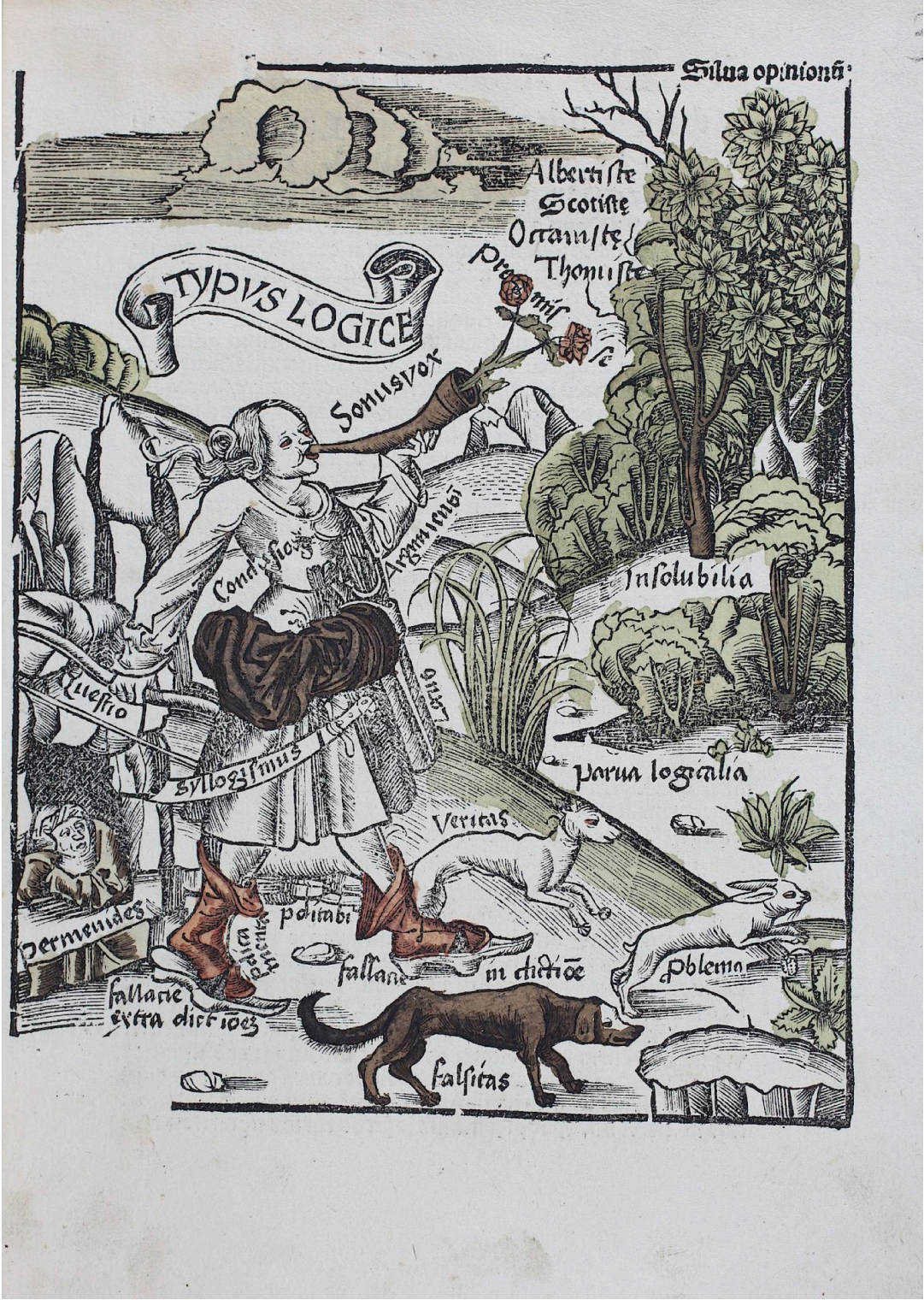
[Fig. 1] « TYPUS LOGICE », Margarita philosophica , Bâle, Schott, 1508, c6r°